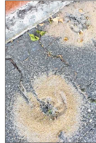
So sieht es zurzeit in der Salierstraße in Otterstadt aus: Zahlreiche Tapinoma-magnum -Ameisen krabbeln auf dem Gehweg.